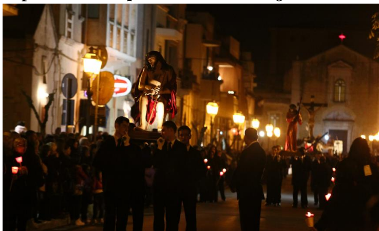
Mesagne-Processione dei Misteri

La Casa per la vita “La Casa di Valentina” nello spirito della legge n. 328 del 2000, della Legge Regionale n.19/2006 e del Regolamento Regionale 4/2007 e s.s.m.i., è parte integrante della rete territoriale dei servizi alla cui programmazione partecipa sia come componente in sede decisionale che come soggetto portatore di istanze e di proposte. La Casa per la vita favorisce al massimo i rapporti dell'utente con l'esterno, aiutandolo a mantenere i contatti con l'ambiente di provenienza e nel contempo ad integrarsi nella nuova realtà di residenza. In tal senso, l'ospite è libero di ricevere visite di familiari, amici e parenti preferibilmente nelle ore pomeridiane. Gli ospiti della struttura partecipano, ad iniziative socio-culturali della Città di Mesagne o dei territori limitrofi, come sagre, mostre, iniziative culturali e cinematografiche. Rientra comunque fra i diritti degli utenti, la possibilità di costituirsi in organismi di rappresentanza e riunirsi per valutare la qualità del servizio erogato.